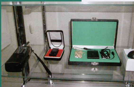
↑これぞ秘密兵器の同社開発製品。