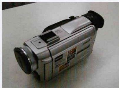
↑「浮気の証拠」を収めるビデオカメラ。