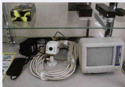
↑行動記録を監視するモニター。