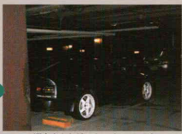
ホテルの滞在もたちどころにバレてしまう！