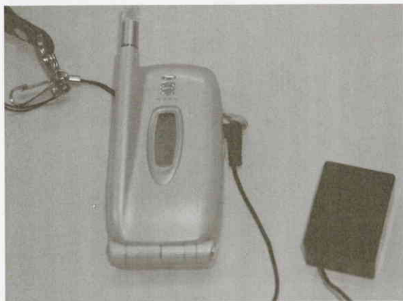
携帯電話専用の小型の盗聴システム

「紙にあなたが関係している男性の名前を何名か書いてもらえますか？」と占い師。素直にSは男の名前を書いてきた。