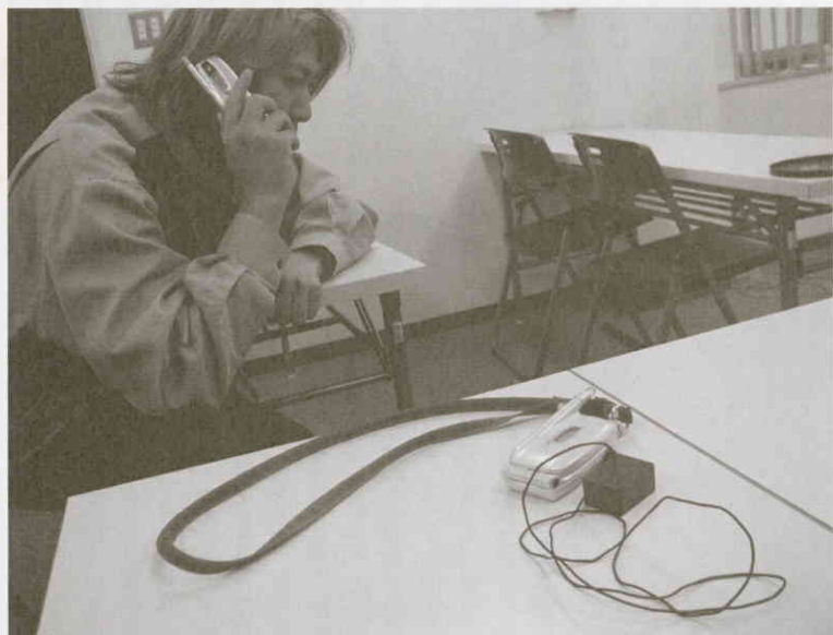
携帯電話での会話を聞けてしまう！

わし続ける。付かず離れずの状態で時間稼ぎするのだ。そうしているうちにK&Yのカップルは結婚が決まった。こうなるとTがYと「元サヤ」になることはない。「ミキ」はTに「実は今度、結婚することになりました。いろいろあ